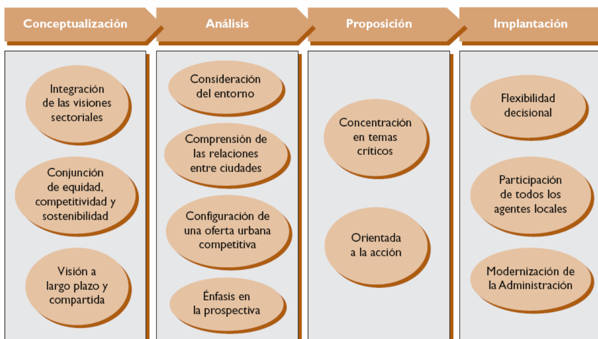
FIG. 2. Características de la planificación estratégica